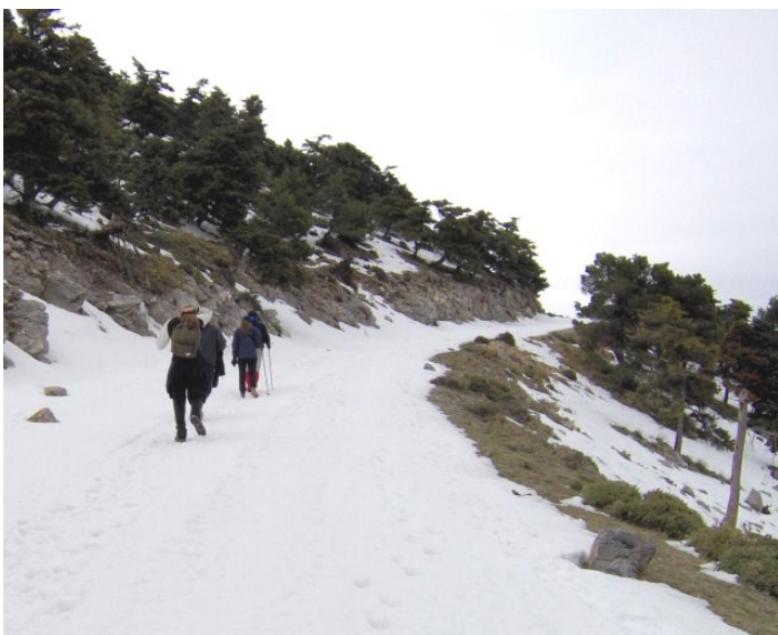
Ανεβαίνοντας προς το καταφύγιο στον Κιθαιρώνα

Στις 22 Ιανουαρίου πραγματοποιήθηκε ορειβατική και τουριστική εκδρομή στην περιοχή των Βιλιών σε δύο σκέλη. Το πρωί έγινε ανάβαση στον Κιθαιρώνα από ομάδα δέκα ατόμων. Το μονοπάτι ήταν δύσβατο λόγω του πάγου, γι' αυτό η ομάδα ακολούθησε τον στρωμένο με χιόνι δρόμο προς το καταφύγιο, όπου και έφθασε μετά από πορεία 3,5 ωρών. Εκεί πραγματοποιήθηκε το κόψιμο