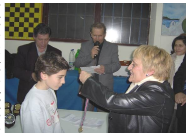
Η κ. Θεοφύλακτου βραβεύει τους νεαρούς σκακιστές.