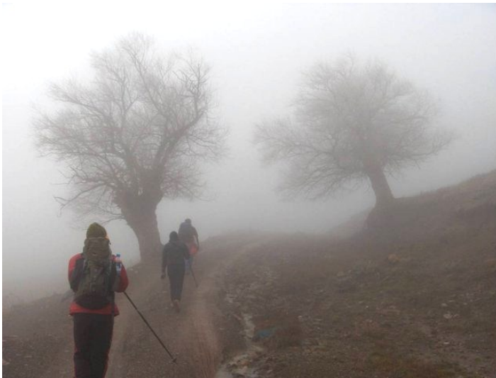
Πορεία σε δύσκολες συνθήκες