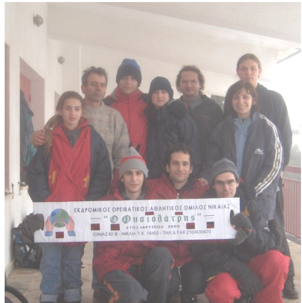
Οι ορειβάτες στο καταφύγιο με το πανό του Ομίλου

της πίτας των ορειβατών (το φλουρί στον αρχηγό) και μετά από μικρή στάση η ομάδα ξεκίνησε την κατάβαση.